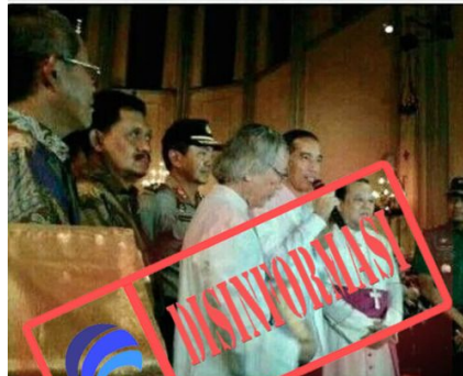
Presiden RI Jokowi datang ke gereja katedral Jakarta. selama 71 tahun RI merdeka, akhirnya Presiden ke 7 yang pertama datang ke gereja katedral. save Jokowi 15